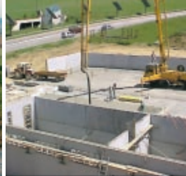
Bassin en béton standard

Être agriculteur aujourd'hui ne représente plus seulement un investissement humain. Hygiène, sécurité, environnement, productivité, maîtrise des coûts... sont les mots d'ordre d'une profession connaissant de profondes mutations matérielles. Associant la technologie avancée et parfaitement maîtrisée du mur précoffré à l'innovation dans les bétons standards et hautes performances, les solutions Fehr autorisent des applications en totale adéquation avec les évolutions du monde agricole.